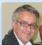
Danilo Ballotta Representante Observatorio Europeo de las Drogas y las Toxicomanías (EMCDDA) del Consejo de Ministros UE