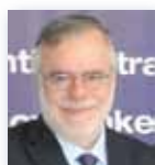
Andrea Riccardi Ministro de Cooperación Internacional e Integración