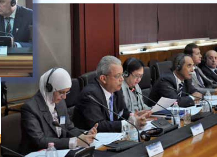
Declaración de las delegaciones