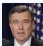
R. Gil Kerlikowske Director, Oficina Nacional de Políticas de Control de Drogas (ONDCP – USA)