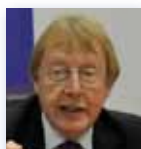
Raymond Yans Presidente del Órgano Internacional de Control de Estupefacientes (INBC)