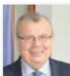
Yury Fedotov Director Ejecutivo de la Oficina ONU contra la Droga y la Delincuencia (UNODC)