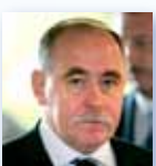
Viktor Ivanov Director del Servicio Federal para el Dontrol de Drogas (Federación Rusa)